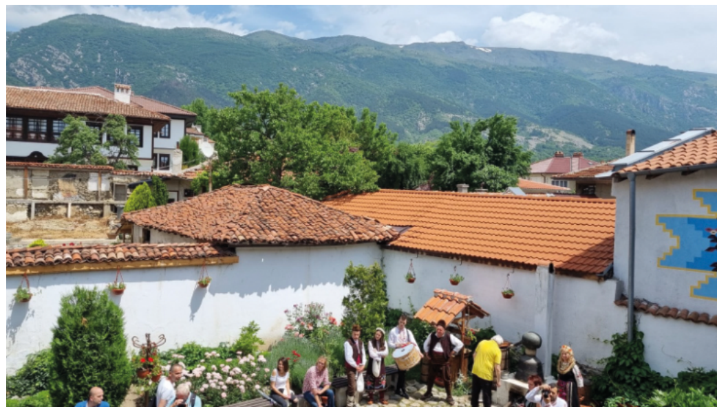
Die Altstadt von Karlovo. Im Hintergrund das Balkangebirge.

Karlovo ist eine 28.000 Einwohner große Stadt in Zentralbulgarien am Rande des Balkangebirges. Berühmt ist die Stadt wegen ihres wertvollen Rosenöls, das für die Parfümindustrie gewonnen wird. Alljährlich wird ein farbenfrohes Rosenfest gefeiert. Sehenswert ist auch die Altstadt mit Museen, Kirchen, Synagoge und dem Vasil-Levski-Denkmal. Der in Karlovo geborene bulgarische Nationalheld kämpfte für die Befreiung Bulgariens von der osmanischen Herrschaft. Die Verbindung mit Karlovo kam aufgrund des historischen Zusammenhangs Bulgariens mit dem hessischen Prinzen Alexander von Battenberg zustande, der als Jugendlicher auf dem Heiligenberg in Jugenheim lebte. Auf Betreiben seines Onkels, Zar Alexander II., wurde er nach der Niederlage der Osmanen im Krieg gegen Russland 1879 mit erst 22 Jahren Fürst des neu gegründeten bulgarischen Staates. Während seiner