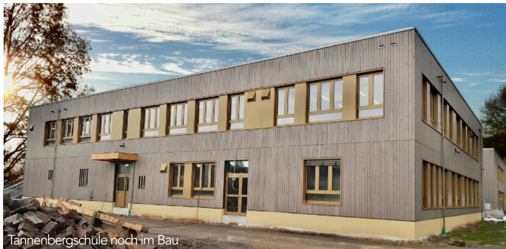
Tannbergsschule noch im Bau

Der Kreis ist als Schulträger zuständig für die Schulgebäude, die Ausstattung der Lehrräume und in personeller Hinsicht für die Kosten der Schulsekretariate und Hausmeisterdienste. Die Lehrkräfte werden vom Land Hessen finanziert. Also eine Gemeinschaftsfinanzierung von Kreis und Land in die Bildung und Zukunft unserer Kinder.